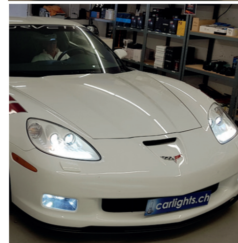
Komplett-Umbau auf LED an einer Corvette