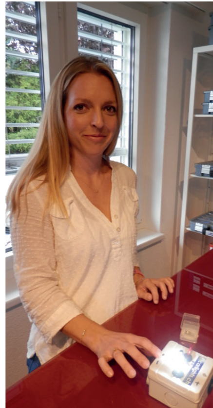
Kompetente Beratung im Carlights-Shop