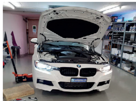
Blick in die Werkstatt in Bellikon