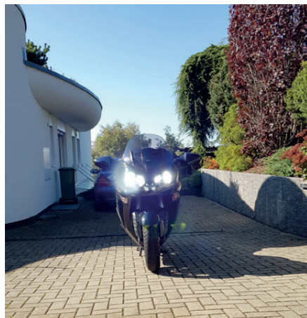
LED-Umbau Motorrad Kawasaki

Bessere Sichtbarkeit – weniger Unfälle Das Unternehmen gibt es seit mittlerweile neun Jahren. Neun Jahre im Dienste besserer Sichtbarkeit des Fahrzeugs. Da reden wir hauptsächlich von Autos. Aber nicht nur. Auch Motorräder, LKW, Feuerwehrautos und sogar Züge oder Pistenfahrzeuge werden und wurden bei/von Carlights schon ins rechte Licht gerückt bzw. mit besserem LED-Licht umgerüstet. Auffallendes, helleres LED – bessere Sichtbarkeit – verhindert Unfälle, verbraucht fünf bis zehn Mal weniger Energie, braucht weniger Strom und dadurch letztlich auch weniger Benzin.