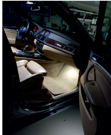
Neue Innenraumbeleuchtung bei einem BMW