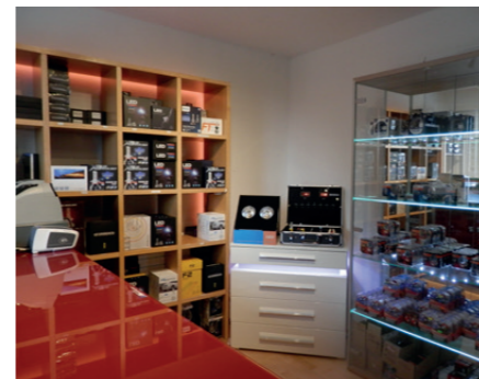
Der Shop ist werktags und am Samstag geöffnet.